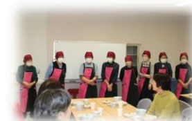
▲コスモス会のみなさん

由仁町社協デイサービスセンターでボランティア団体、健康生活ネットワーク茶の湯にひなまつり茶会を行っていただきました。ご協力ありがとうございました。