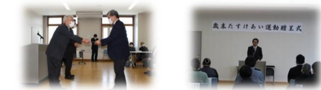
▲歳末たすけあい贈呈式